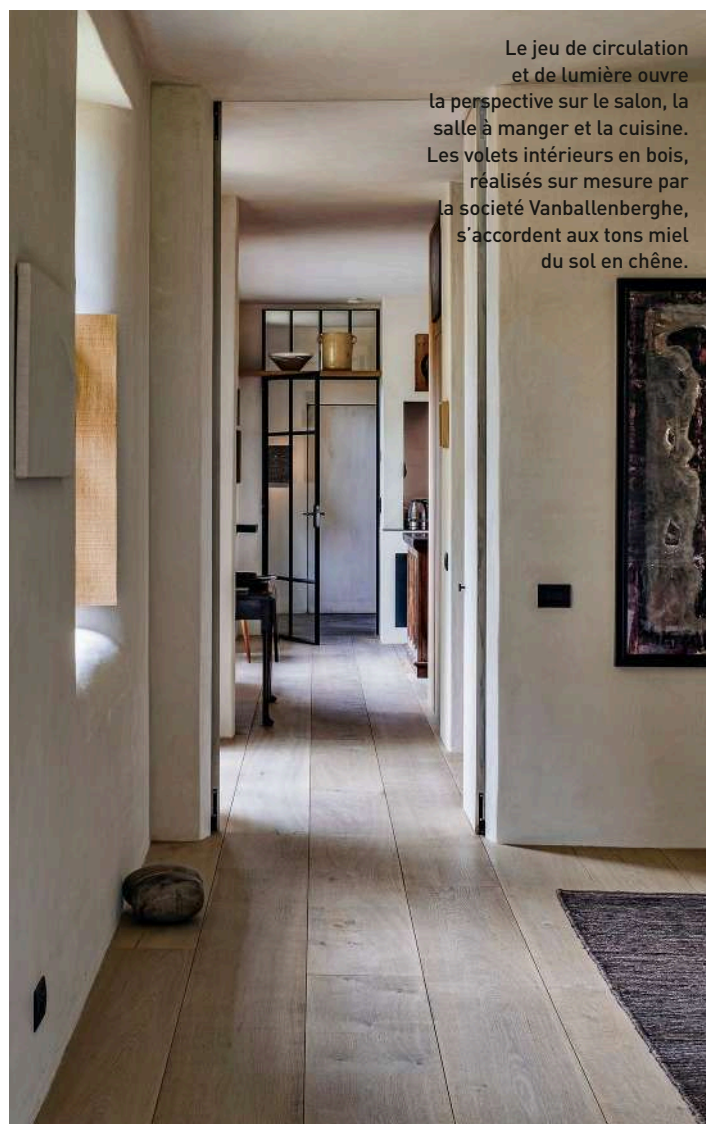
Le jeu de circulation et de lumière ouvre la perspective sur le salon, la salle à manger et la cuisine. Les volets intérieurs en bois, réalisés sur mesure par la société Vanballenberghe, s'accordent aux tons miel du sol en chêne.