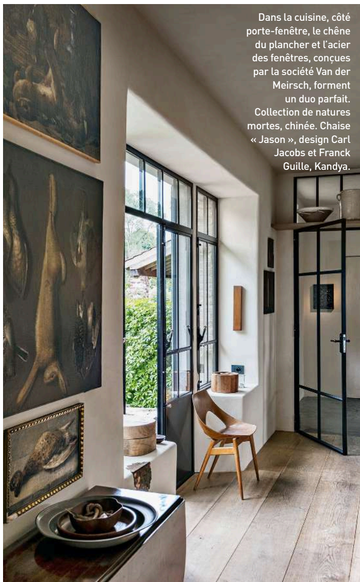
Dans la cuisine, côté porte-fenêtre, le chêne du plancher et l'acier des fenêtres, conçues par la société Van der Meirsch, forment un duo parfait. Collection de natures mortes, chinée. Chaise « Jason », design Carl Jacobs et Franck Guille, Kandya.