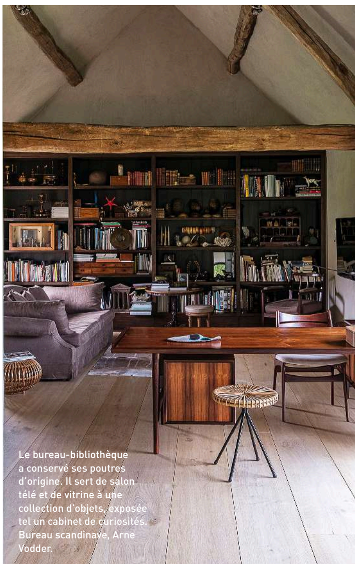
Le bureau-bibliothèque a conservé ses poutres d'origine. Il sert de salon télé et de vitrine à une collection d'objets, exposée tel un cabinet de curiosités. Bureau scandinave, Arne Vodder.